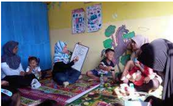
Gambar: kegiatan komunitas parenting dalam diskusi kelompok

Kemunculan enam fasilitator lokal yang secara sukarela mengambil peran kepemimpinan dalam komunitas menunjukkan proses kaderisasi yang berhasil. Hal ini sejalan dengan teori local leadership development yang menekankan pentingnya pemberdayaan tokoh-tokoh lokal sebagai agen perubahan yang berkelanjutan. Temuan ini diperkuat oleh penelitian Triwulandari et al. (2021) yang menyatakan bahwa kemunculan pemimpin lokal dalam komunitas pendidikan nonformal merupakan indikator keberhasilan program pemberdayaan masyarakat berbasis nilai.