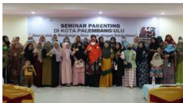
Gambar: workshop kegiatan parenting Islami dalam membacakan cerita kepada anak

Efektivitas storytelling sebagai metode pendidikan karakter dapat dipahami melalui teori pembelajaran konstruktivisme, dimana anak membangun pemahaman tentang nilai moral melalui cerita yang didengar dan dialami. Cerita-cerita Islami tidak hanya menyampaikan pesan moral secara eksplisit, tetapi juga memungkinkan anak untuk mengidentifikasi diri dengan tokoh-tokoh dalam cerita, sehingga proses internalisasi nilai menjadi lebih mendalam. Temuan ini didukung oleh penelitian Kusuma & Ramadhan (2023) yang menyatakan bahwa tradisi bercerita tidak hanya meningkatkan keterampilan literasi tetapi juga membentuk kepribadian dan karakter moral anak sejak usia dini