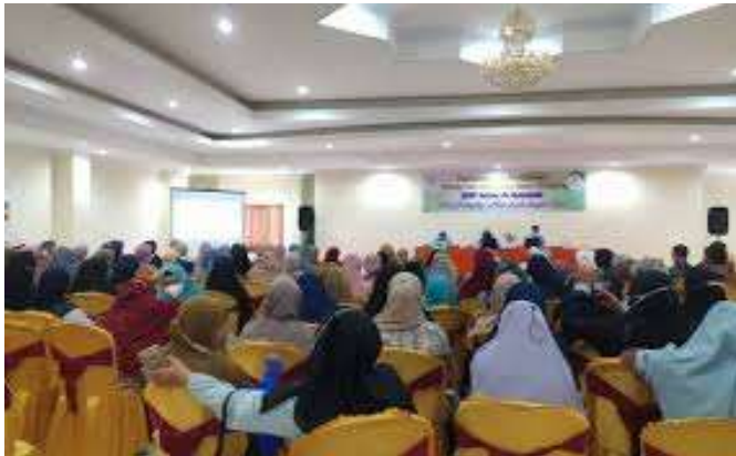
Gambar: Suasana workshop parenting Islami dengan metode interaktif

Secara praktis, model pengabdian ini dapat menjadi rujukan untuk program-program serupa di komunitas lain. Komponen-komponen kunci seperti pendekatan partisipatif, pengembangan fasilitator lokal, dan penciptaan struktur komunitas yang mendukung terbukti efektif dalam menciptakan perubahan sosial yang berkelanjutan.