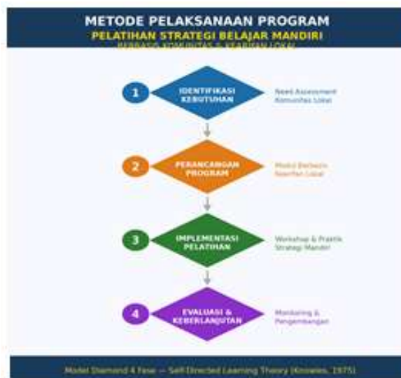
Gambar 1. Kerangka Model Diamond 4 Fase Metode Pelatihan Strategi Belajar Mandiri Berbasis Kearifan Lokal

Timeline pelaksanaan dirancang selama tujuh bulan dengan jadwal kegiatan yang fleksibel menyesuaikan kalender komunitas dan musim pertanian lokal. Fase identifikasi kebutuhan dilakukan pada bulan pertama dan kedua, pelaksanaan pelatihan intensif berlangsung dari bulan ketiga hingga keenam, dan evaluasi serta perencanaan keberlanjutan dilakukan pada bulan ketujuh. Setiap kegiatan didokumentasikan secara sistematis untuk keperluan monitoring, evaluasi, dan pembelajaran. Penggunaan media digital sederhana seperti grup WhatsApp untuk pemantauan progress belajar dan video tutorial berbasis kearifan lokal juga diintegrasikan untuk meningkatkan aksesibilitas dan keterlibatan anggota komunitas yang tinggal di lokasi terpencil (Thompson & Davis, 2024; Rodriguez et al., 2023).