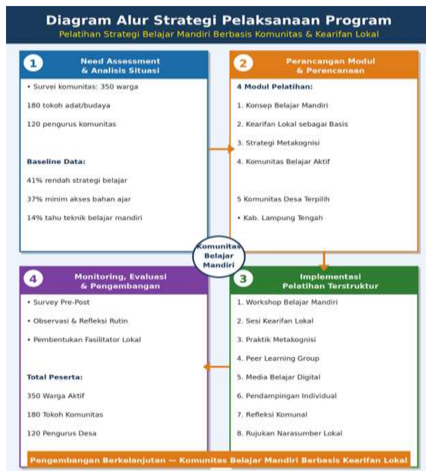
Gambar 2. Diagram Alur Strategi Pelaksanaan Program Pelatihan Strategi Belajar Mandiri Berbasis Komunitas dan Kearifan Lokal

Aspek inovasi dari program ini terletak pada penggunaan pendekatan indigenous knowledge-based learning di mana kearifan lokal tidak sekadar menjadi ornamen program, melainkan fondasi epistemologis yang membangun kerangka berpikir dan strategi belajar peserta. Pengetahuan tradisional tentang bertani, meramu, mendidik anak, dan memelihara lingkungan yang dimiliki komunitas diolah menjadi modul-modul strategi belajar mandiri yang kontekstual dan relevan. Konten pembelajaran dikemas dalam format yang akrab dengan budaya lokal seperti cerita rakyat, permainan tradisional, lagu daerah, dan forum musyawarah adat. Elemen gamifikasi berbasis tradisi lokal juga diintegrasikan untuk meningkatkan keterlibatan dan retensi peserta. Kolaborasi dengan seniman lokal, dalang, dan pemangku adat dilakukan untuk memastikan otentisitas dan daya terima program di komunitas (Martinez & Lee, 2024; Kim et al., 2023).